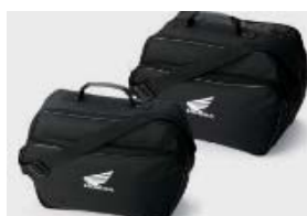
Kit coffres latéraux 29l.