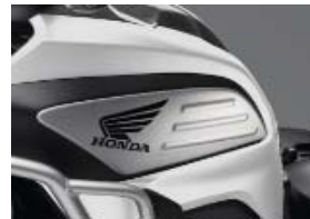
Kit panneaux latéraux