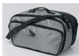
Sac pour top box "Deluxe"