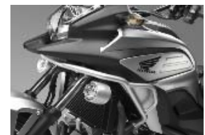
Kit panneaux latéraux