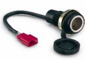
Prise électrique 12V