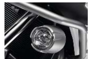
Feux de brouillard LED